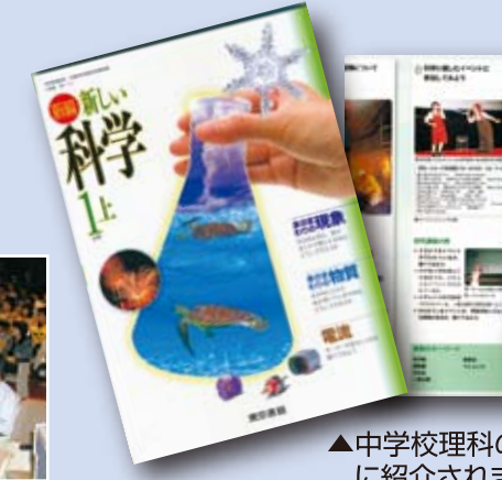
▲中学校理科の教科書に紹介されました。(東京書籍)