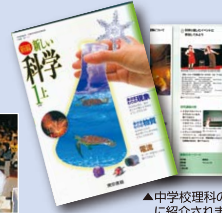
▲中学校理科の教科書に紹介されました。(東京書籍)